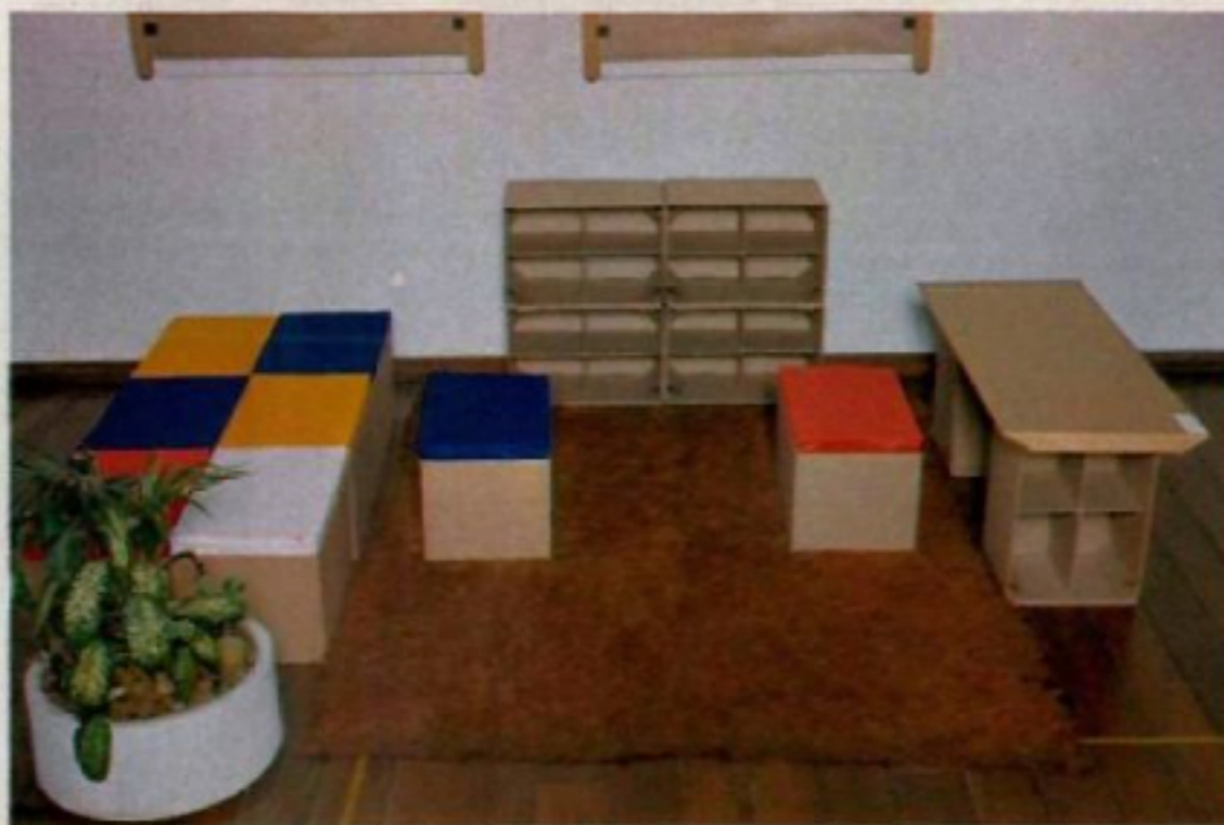
Mobília infantil em papelão: permitindo rabiscar, furar e destruir

apenas a transferência da criatividade do artista para outra área."