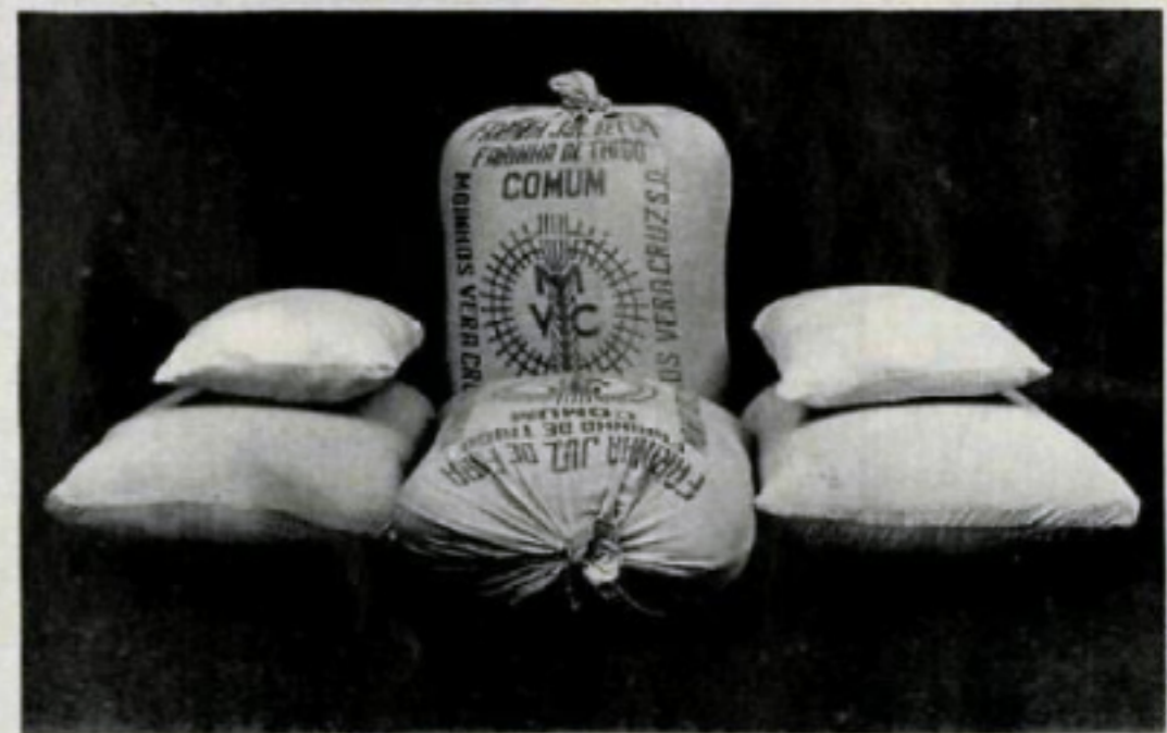
Sofás em sacos de aniagem: charme nas marcas e boa improvisação