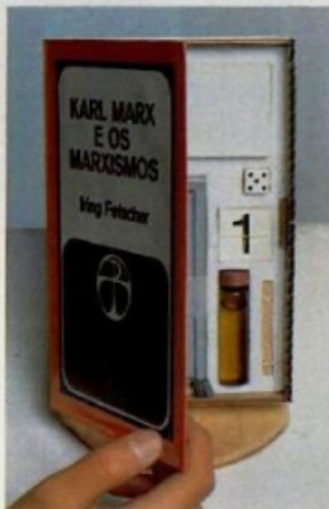
Um livro político que se torna uma caixinha, dentro da tradição do vanguardista Duchamp