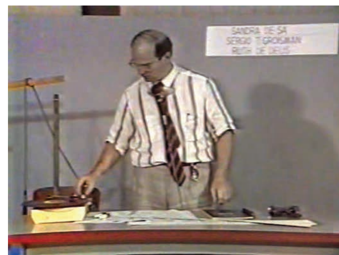
Frames do programa Encontro com a Arte e a Ciência [Frames of the show Meeting between Art and Science

TV MIX IV - TV Gazeta, São Paulo, 1989-1990